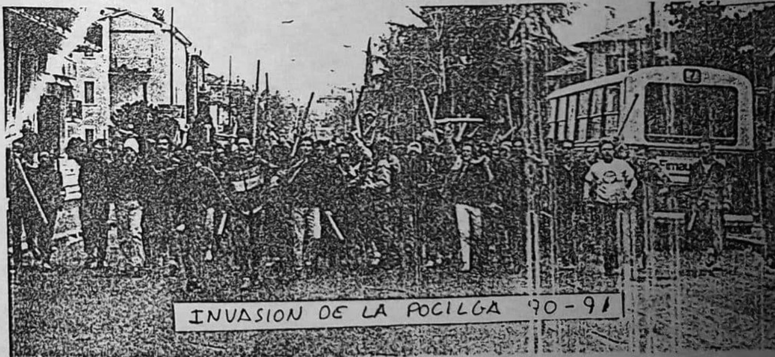
INVASION DE LA POCILGA 90-91

UN SOLO CLUB EN LA CIUDAD : SEVILLA F.C.!!!